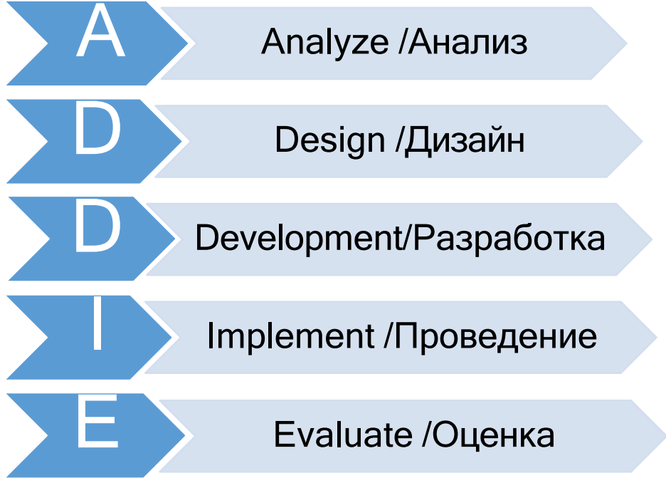
Рисунок 1 – Модель педагогического дизайна ADDIE