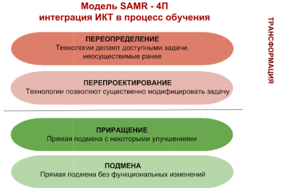
Рисунок 2 – Модель SAMR-4П